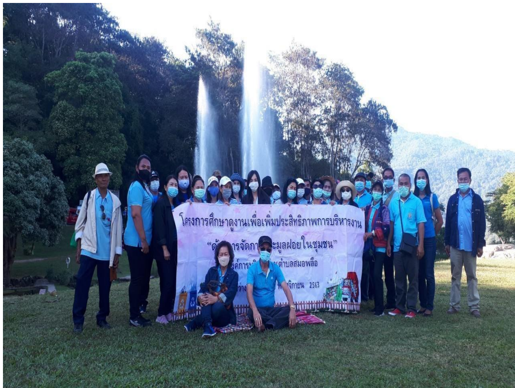
รายงานผลการติดตามและประเมินผลแผนพัฒนาองค์การบริหารส่วนตำบลสมอพลี ประจำปีงบประมาณ พ.ศ. ๒๕๖๔