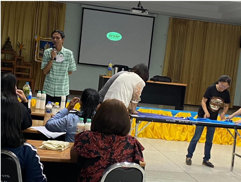
รายงานผลการติดตามและประเมินผลแผนพัฒนาองค์การบริหารส่วนตำบลสมอพลี ประจำปีงบประมาณ พ.ศ. ๒๕๖๔