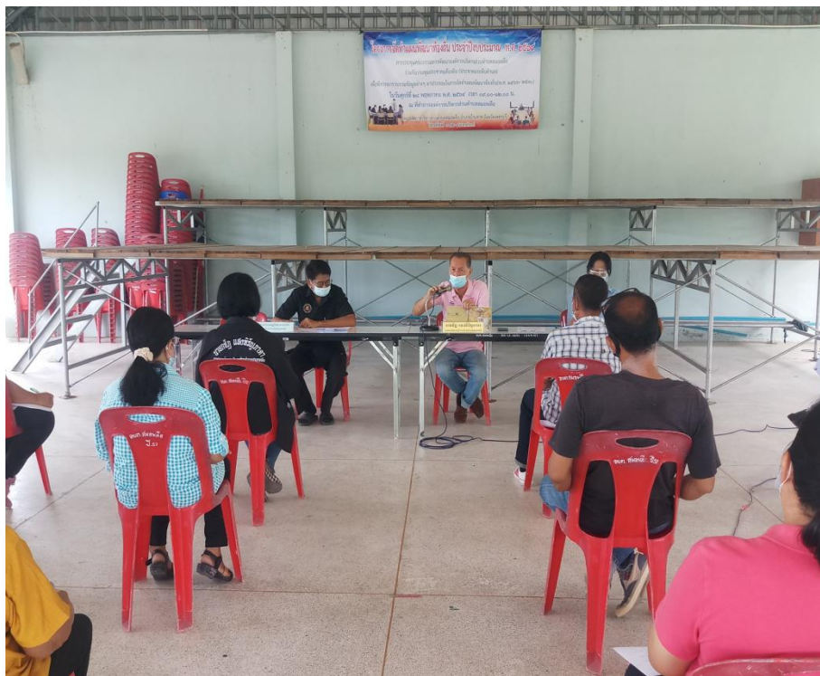
รายงานผลการติดตามและประเมินผลแผนพัฒนาองค์การบริหารส่วนตำบลสมอพลือ ประจำปีงบประมาณ พ.ศ. ๒๕๖๔