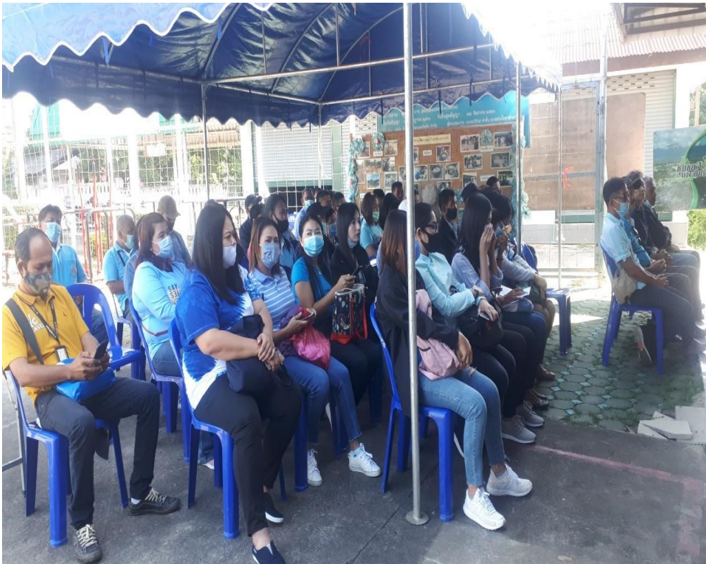
โครงการปรับปรุงอาคารศูนย์พัฒนาเด็กเล็ก