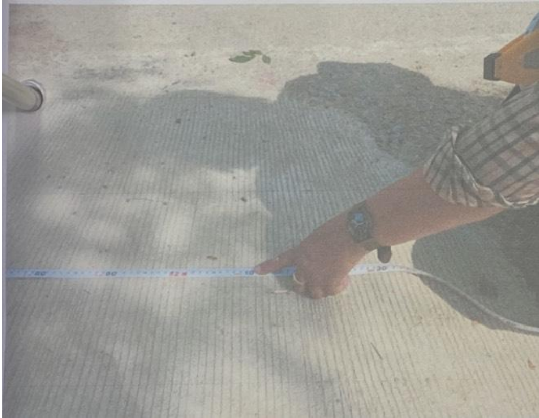
โครงการปรับปรุงถนน คสล. ด้วยแอสฟัลท์ติกคอนกรีต หมู่ ๒ จากแยกคลองชลประทาน