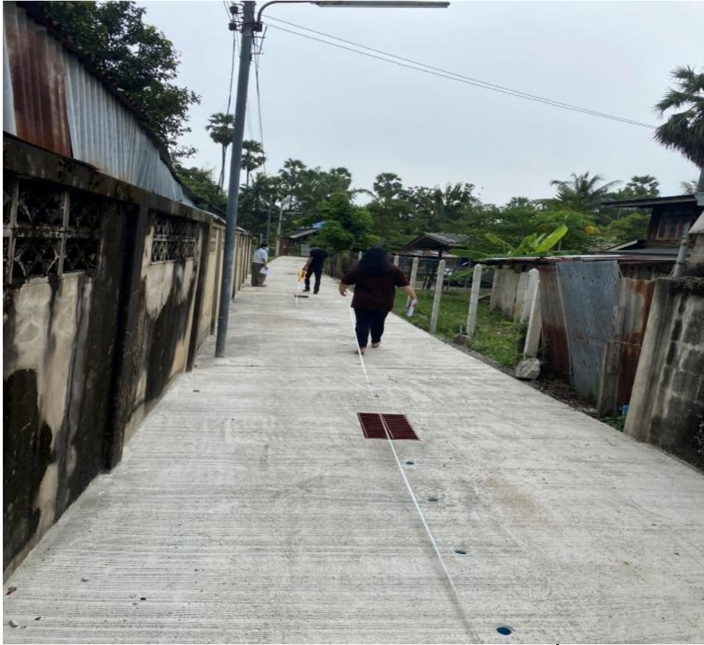
โครงการเสริมไหล่ทางถนนคอนกรีตเสริมเหล็ก หมู่ ๔ จากที่นายโย ถมเสาร์ - สุดซอยที่นายจำรัส ช้างพลาย